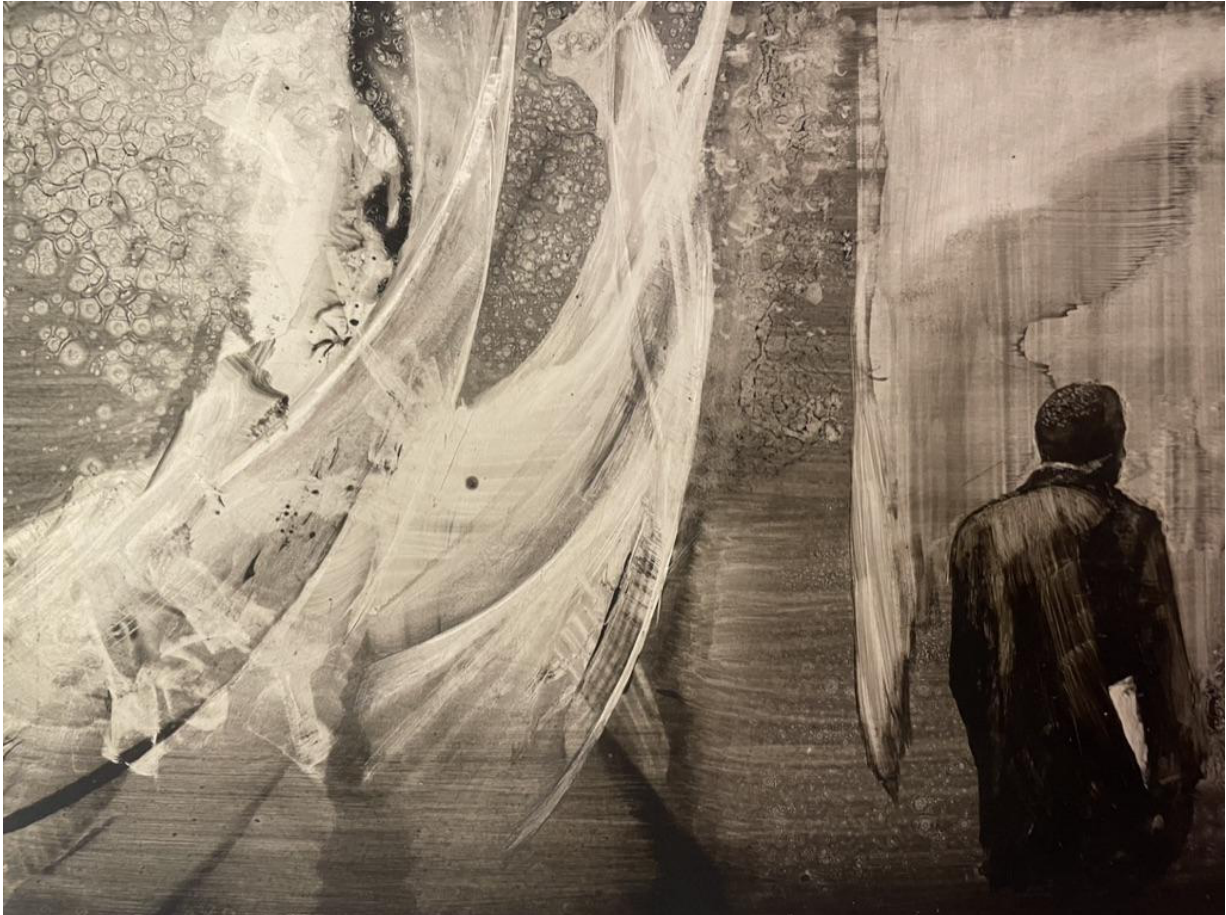
Peinture Kamel Khelif