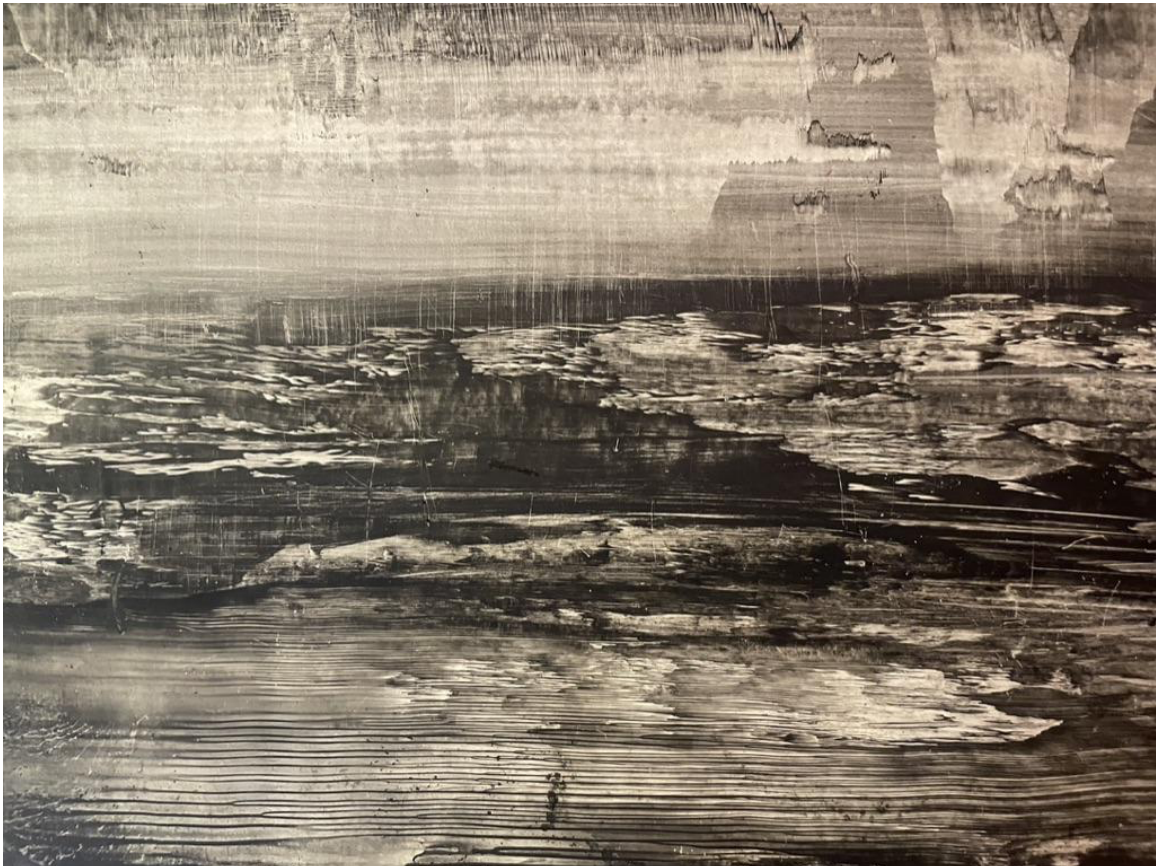
Peinture Kamel Khélif

Né à Alger, Kamel Khélif vit à Marseille depuis le milieu des années 1960. Artiste autodidacte, inventeur de ses propres techniques de peinture, il est l'auteur d'une œuvre inclassable qui chemine entre l'art, la littérature et l'essai. De Homicide (avec Amine Medjdoub, Z'éditions, 1996,) à Même si c'est la nuit (Otium, 2019) en passant par ses ouvrages conçus avec Nabile Farès (dont La jeune femme et la mort , 2010, Rackham), Kamel Khélif convoque notre rapport à la mémoire, à l'exil, au métissage des cultures.